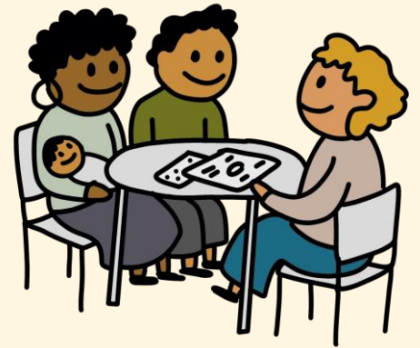
Mütter- und Väterberatung