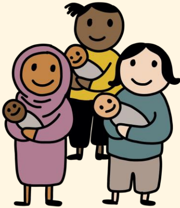
Mittagstisch für Eltern mit Babys