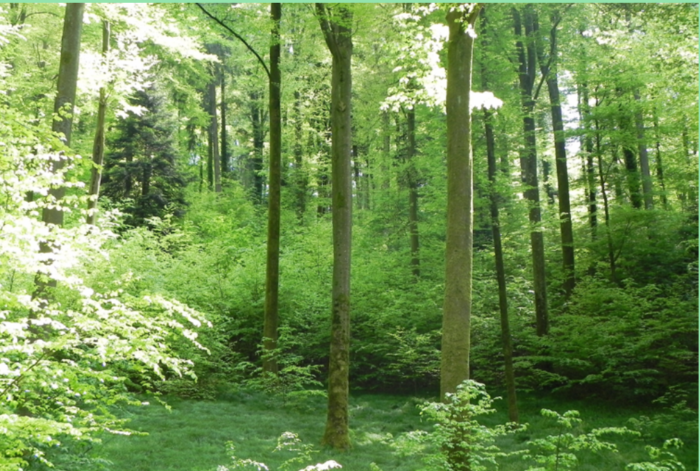
Suhrer Wald