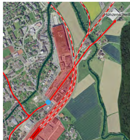
Abbildung 1: Räumliche Grenzen durch Verkehrsachsen und Industriegürtel.

Um schnell und sicher von einem Ortsteil in einen anderen zu gelangen, sind sichere Übergänge wichtig – vor allem für Schülerinnen oder Senioren, die besonders auf gute Wege im Langsamverkehr angewiesen sind. Der Schulweg ist ein wichtiger Übergang vom Zuhause zum Schulhaus und ein wichtiger Lernort für Kinder. Sie pflegen da die Kontakte zu Freundinnen und Freunden, was ihre sozialen Kompetenzen stärkt. Die Schülerinnen und Schüler lernen den Umgang mit dem motorisierten Verkehr und üben, sicher und autonom zu sein. Dazu brauchen sie sichere Verkehrswege und zu Beginn Begleitung von Erwachsenen. Die Quartierentwicklung Suhr möchte im kommenden Jahr in Zusammenarbeit mit der Schule die Entstehung von Laufgemeinschaften fördern, damit die Schulkinder weniger mit dem Auto zur Schule gebracht werden und mit dem Schulweg positive Erlebnisse verbinden können.