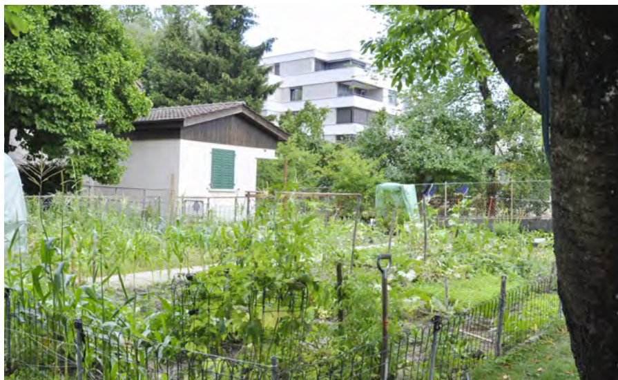
Der Nachbarschaftsgarten an der Tramstrasse 8

Seit zwei Jahren betreiben Suhrer EinwohnerInnen an der Tramstrasse 8 einen Nachbarschaftsgarten. Der Garten ist ein Erfolg: Die Zahl der Gärtnerinnen und Gärtner hat sich im zweiten Jahr verdoppelt. Bereits haben sich weitere Interessierte fürs nächste Jahr gemeldet.